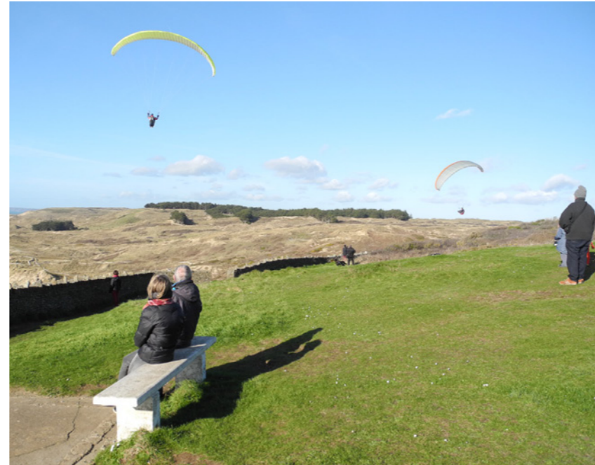
Pratique du parapente aux abords du phare.