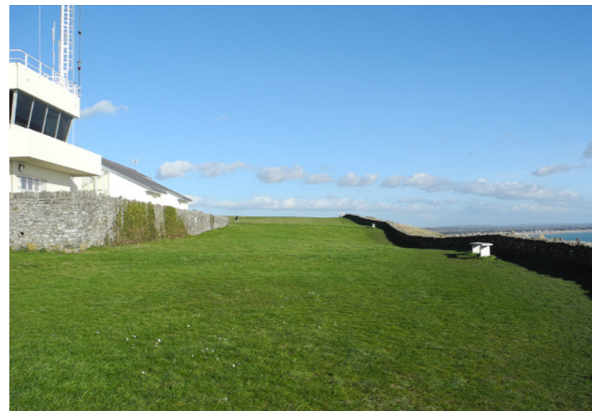
Espace enherbé autour du phare.