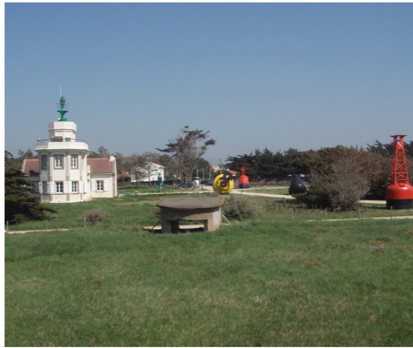
Mise en scène des mâts et balises colorées.