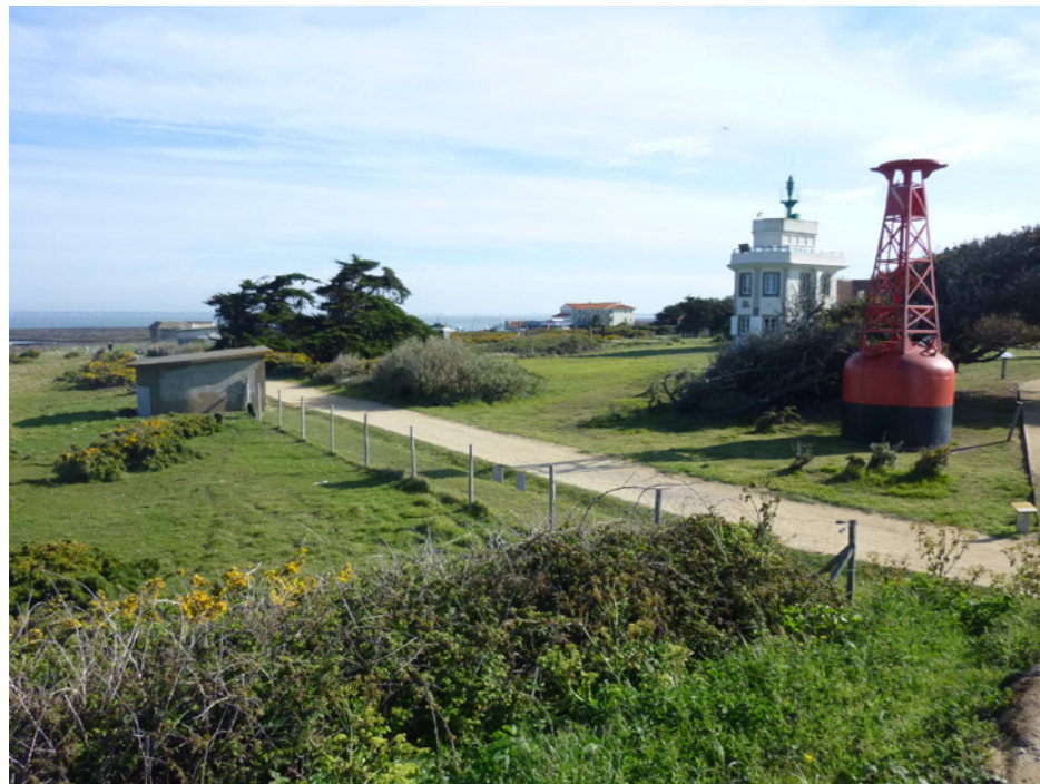
Mise en réseau des parcours et de l'histoire du site.

CHEMINEMENT, POINTE SAINT-GILDAS, PRÉFAILLES, PHYTOLAB.