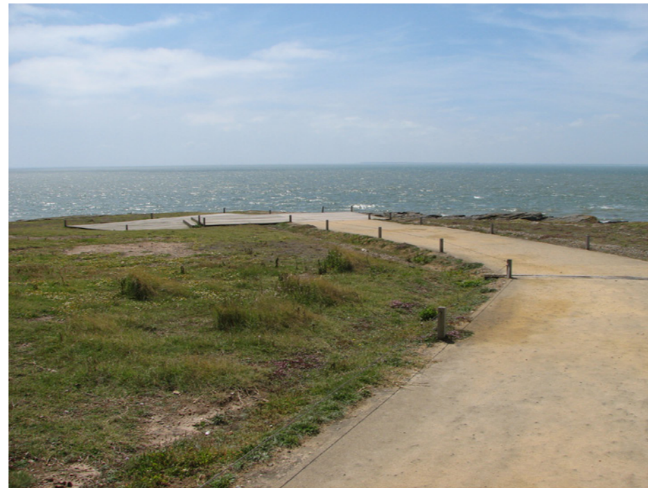
Cheminements en stabilisé qui délimite la promenade sur la pointe Saint-Gildas.