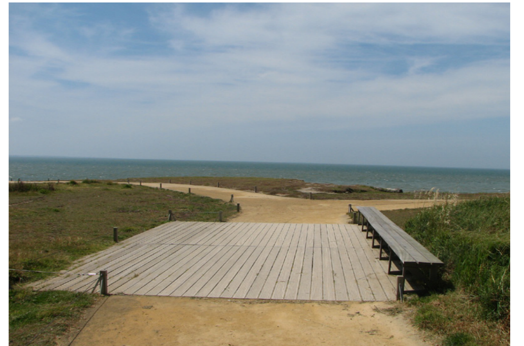
Des belvédères et assises viennent rythmer la promenade.