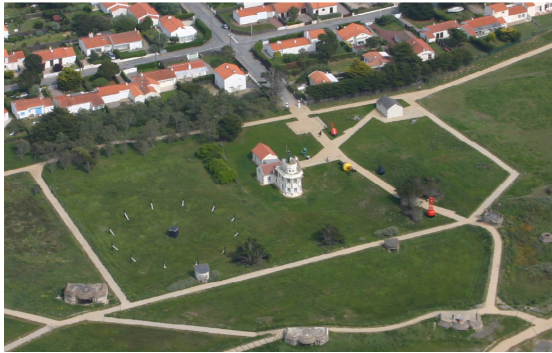
Espace d'interprétation au abords du sémaphore.

SÉMAPHORE, POINTE SAINT-GILDAS, PRÉFAILLES, PHYTOLAB