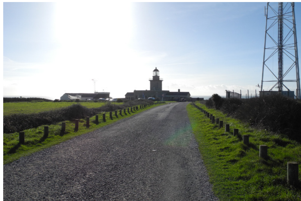
Arrivée au phare depuis la rue du Cap.