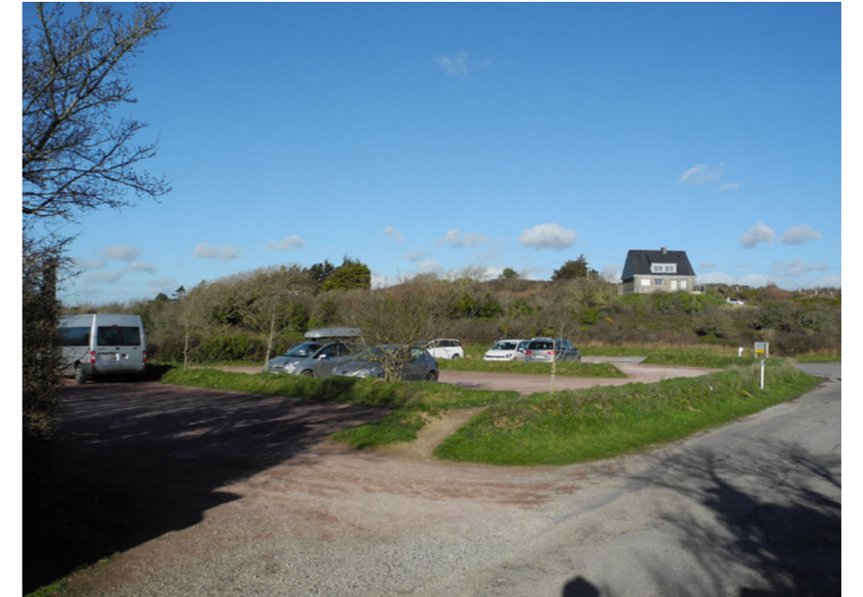
Parking à l'extérieur de l'enceinte du phare.