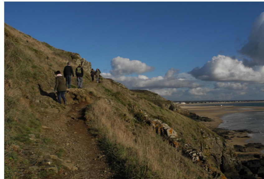
Chemin des douaniers au pied du phare.