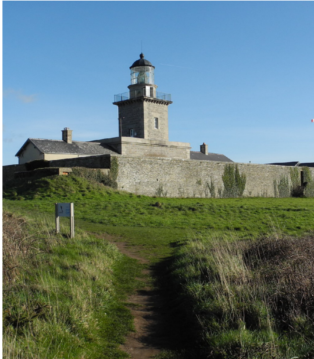
Arrivée au phare depuis le chemin des douaniers