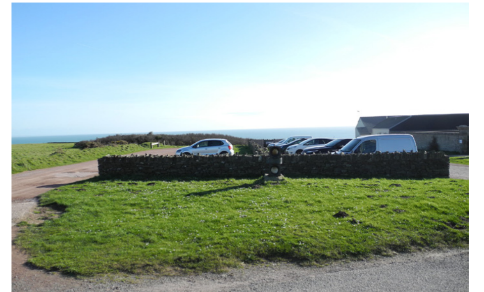
Parking existant dans l'enceinte du phare.