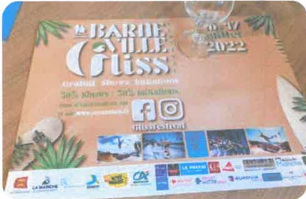
Sets de table A3