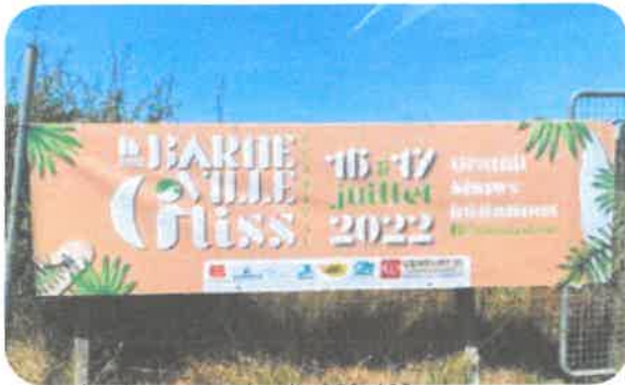
Banderoles entrée de ville 350x100cm